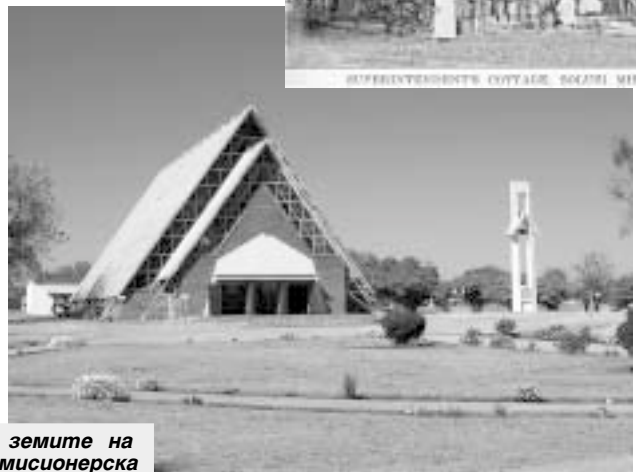
ДИВЕРСЕРСКАТА СТАНЦИЯ „СОЛУСИ“

ли, дядо отишъл при губернатора и поискал да му отдели земя за мисионерска станция. Предложил да плати. Обаче сър