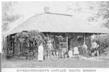
МИСИОНЕРСКАТА СТАНЦИЯ „СОЛУСИ“

то няма да се смесват с другите пациенти.“ Седмича по-късно (помнете, най-малко три до четири седмици са необходими, за да пристигне едно писмо от Америка), но само седмица след като взел решението, пристигнало писмо от Елн Уайт, в което тя казвала, че й било показано във видение, че той не използвал правилно средствата си.